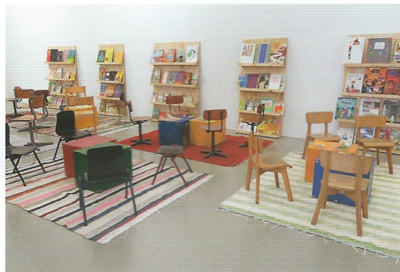
Library (detail)

In the "Art and Religion Room" objects and symbols of Christianity, Buddhism, Judaism, Islam, and Hinduism are brought together with various different African religions in a cross-shaped wooden structure, challenging their hierarchies and differences. Devotional objects are combined with ordinary objects such as plastic dolls and rear-view mirrors, suggesting that spirituality