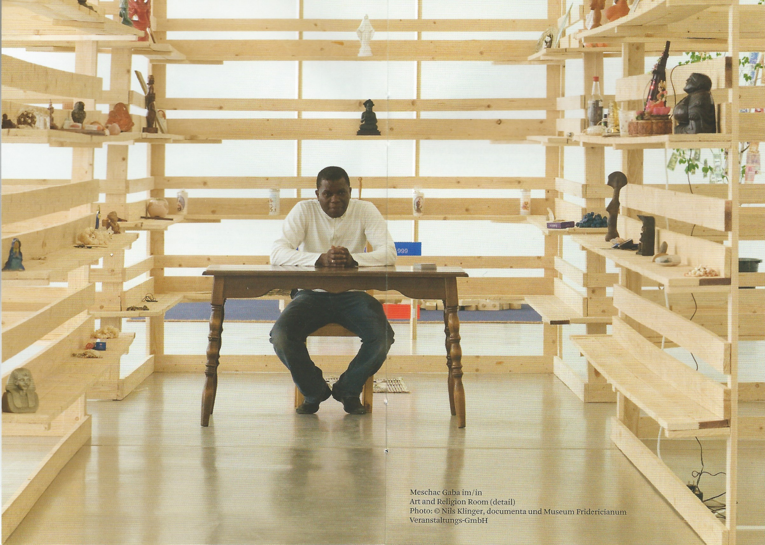
Meshae Gaba im/in Art and Religion Room (detail)